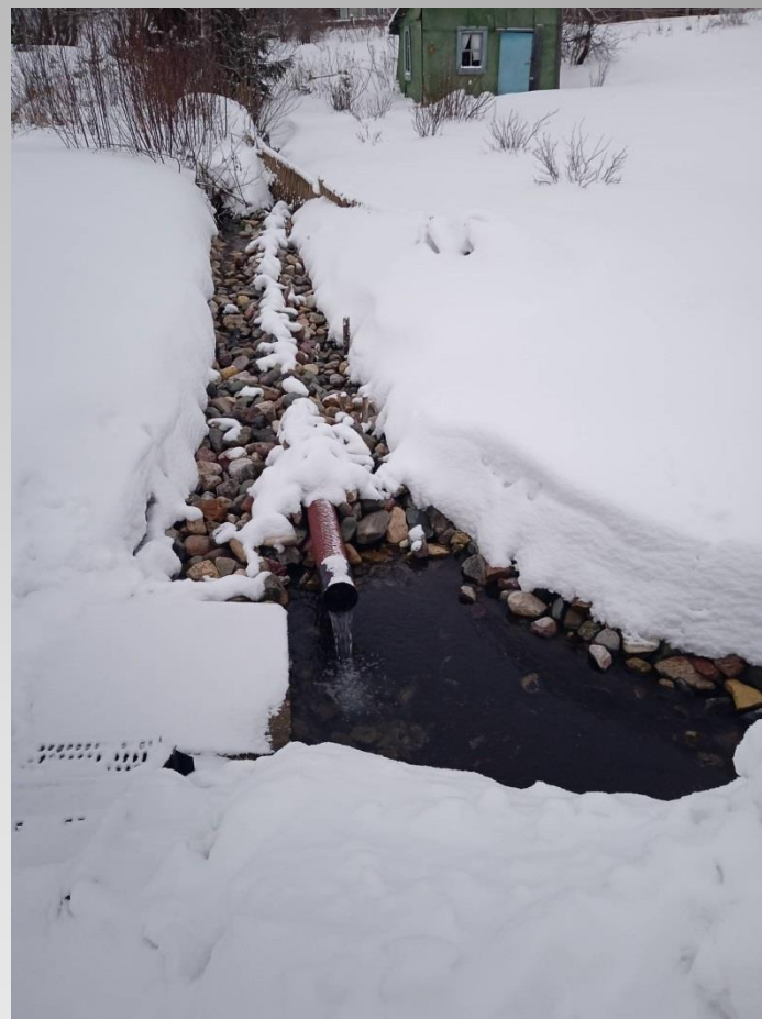
Устройство родника в д.Демсино с/п Чуровское Шекснинского муниципального района