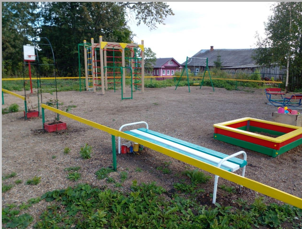
Детская площадка д.Поповское с/п Сиземское Шекснинского муниципального района