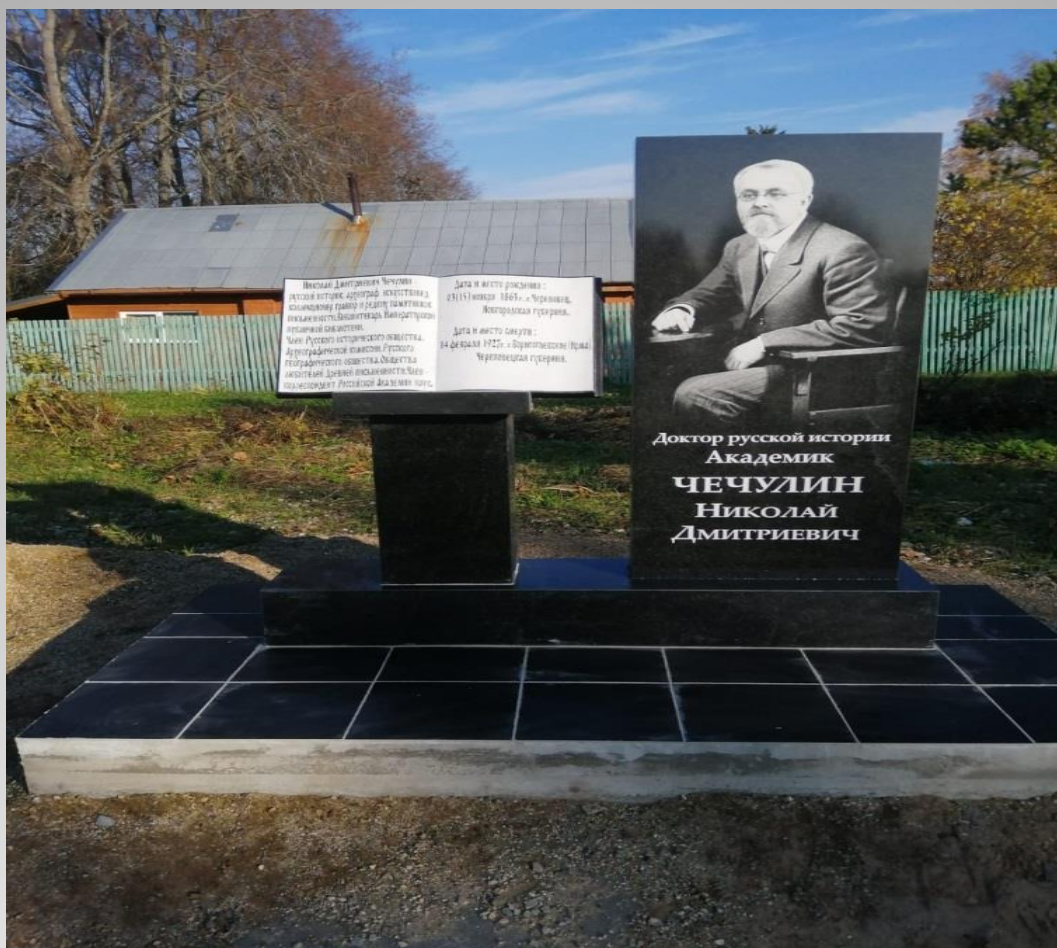
Ремонт памятника Н.Д. Чечулину в д.Ирма с/п Ершовское Шекснинского муниципального района