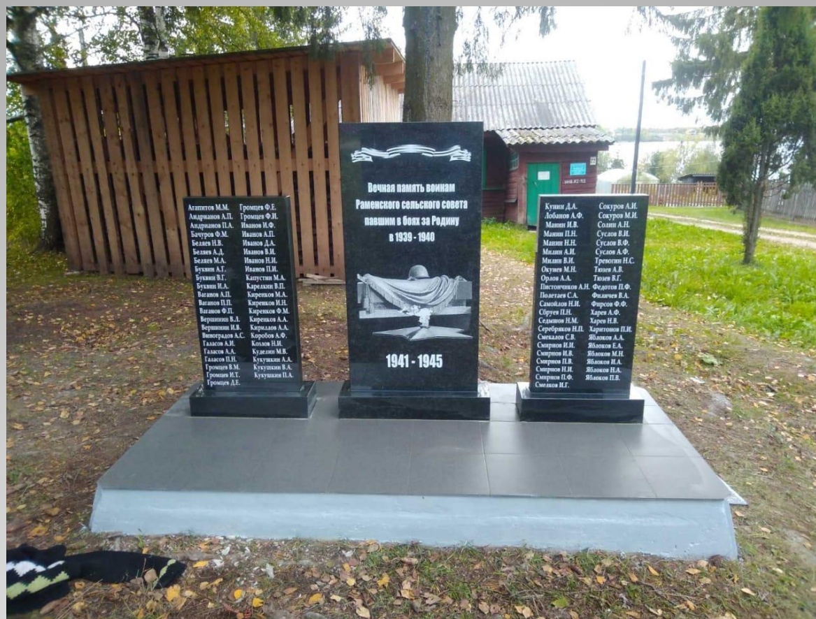
Ремонт Мемориала Воинской Славы в д. Левинская с/п Ершовское Шекснинского муниципального района