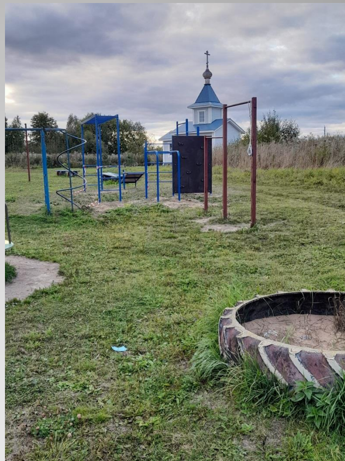
Обустройство детской площадки д. Едома с/п Железнодорожное Шекснинского муниципального района