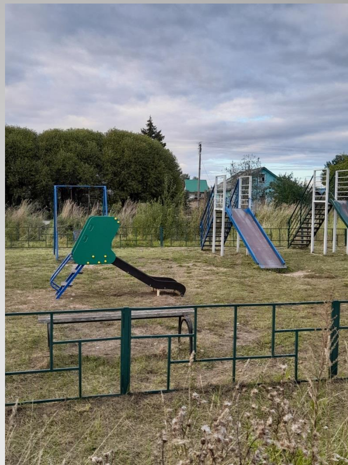
Обустройство детской площадки д. Пача с/п Железнодорожное Шекснинского муниципального района