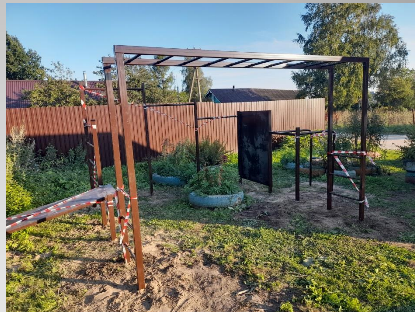
Обустройство детской площадки в д.Кичино с/п Железнодорожное Шекснинского муниципального района