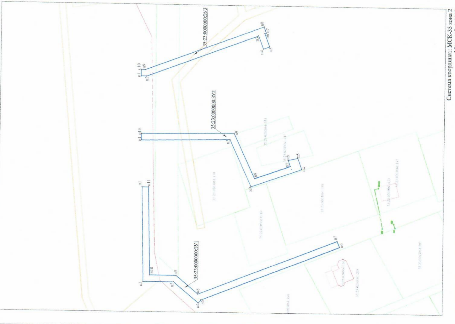
Схема границ земель или части земельного участка на кадастровом плане территории для размещения объекта: «Распределительные газопроводы с газопроводами вводами д. Спозово Чуровского сельского поселения Шекснинского района 2-ая очередь строительства (шифр 35-21-035-000681-2-ГСН)»

Утверждена Постановлением Администрации Шекснинского муниципального района от _____ № _____