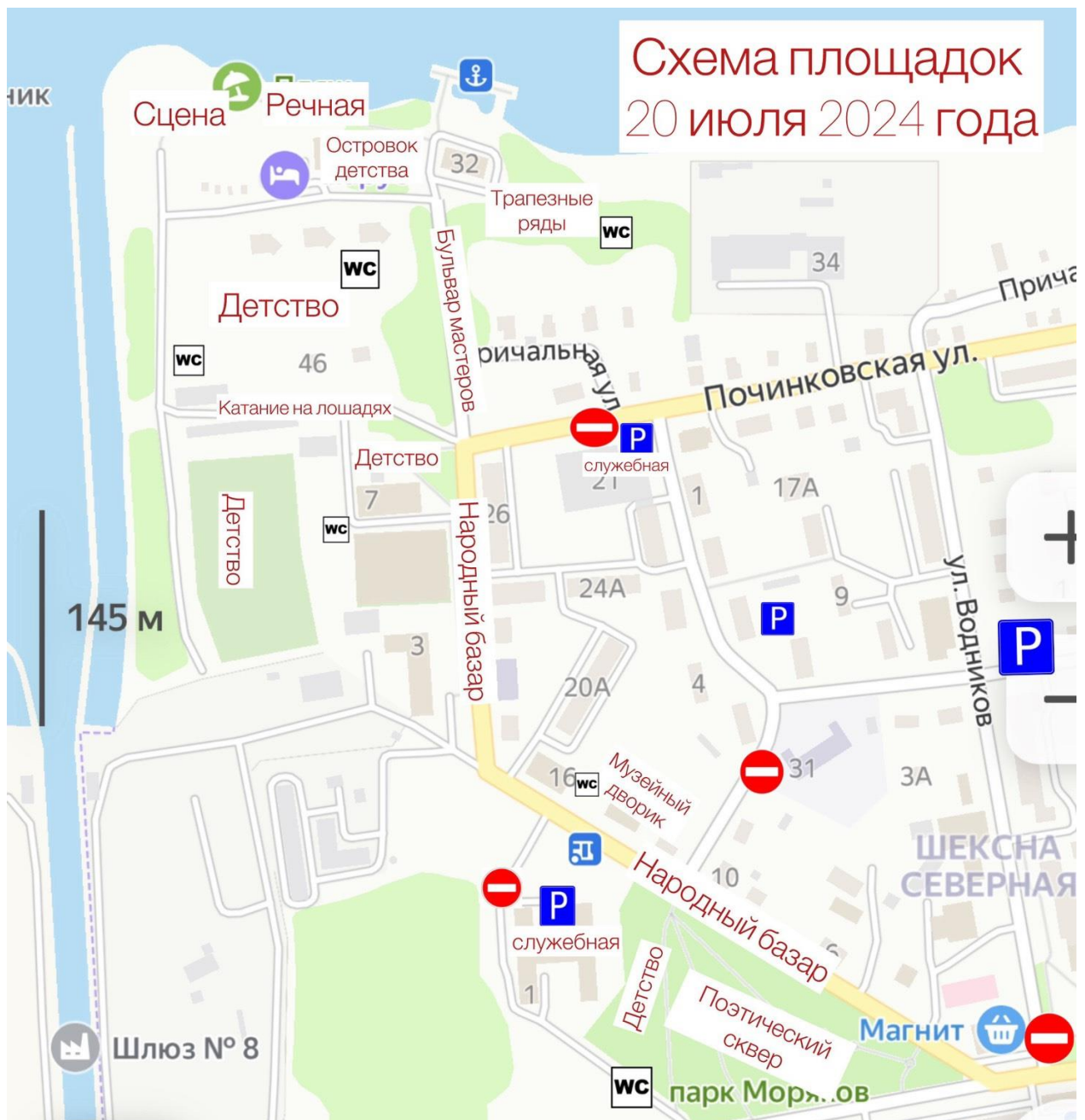
Схема расположения площадок районной ярмарки 20 июля 2024 года